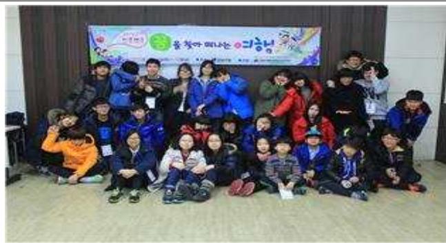
공동체 워크숍 단체사진