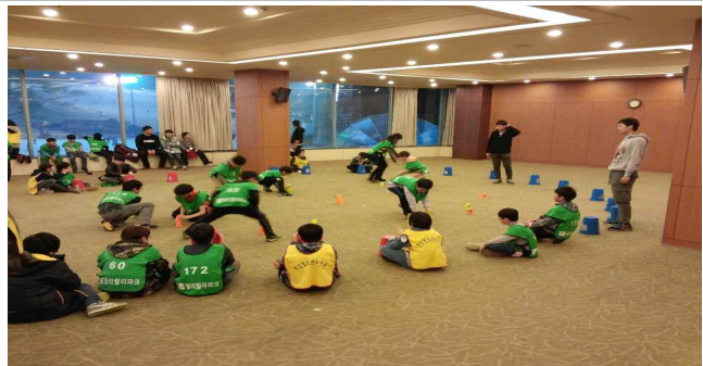
공동체 워크숍 - 스포츠(컵쌓기)스태킹