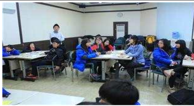
공동체 워크숍 직업골든벨_직업가치관경매