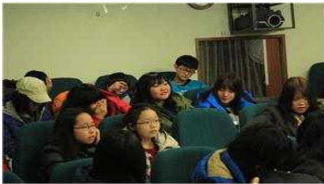
꿈을 찾아 떠나는 여행 - 꿈찾기 강의