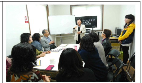
생활수화 디딤돌반 수료식