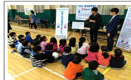
인식개선 문화나눔 행사(월곡초)