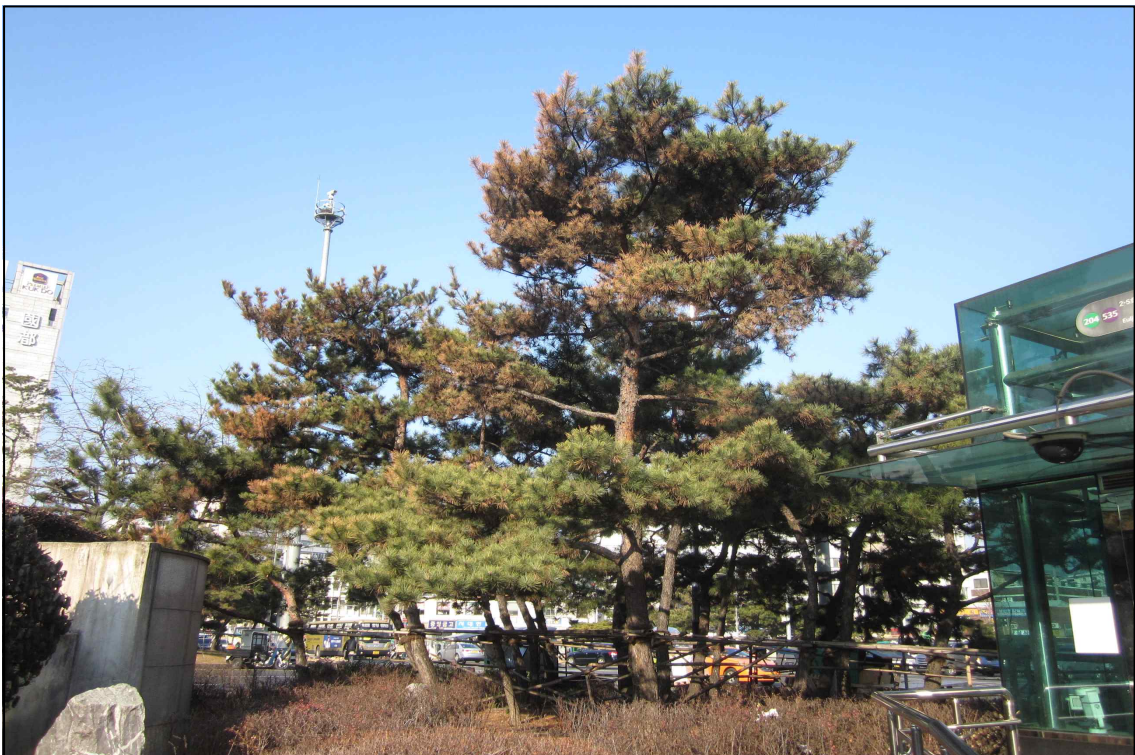
녹지대 수형조절 및 전지