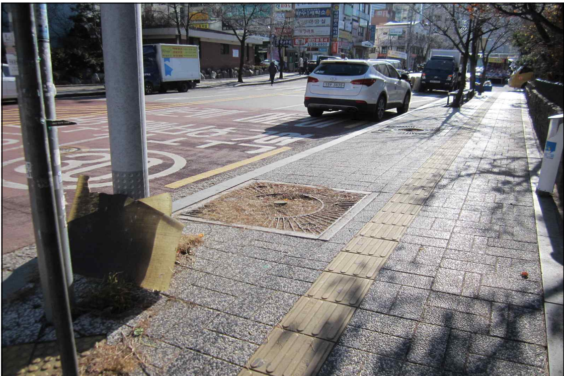
가로수 결주 조사