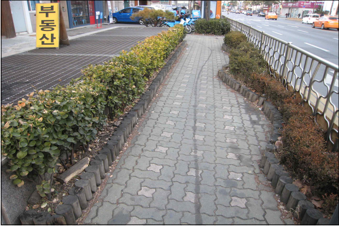
보행 불편 초래하는 띠녹지 보도 복구(보도폭 협소)