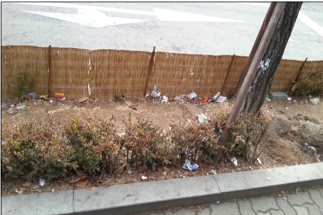
상습 훼손 녹지 보도 복구