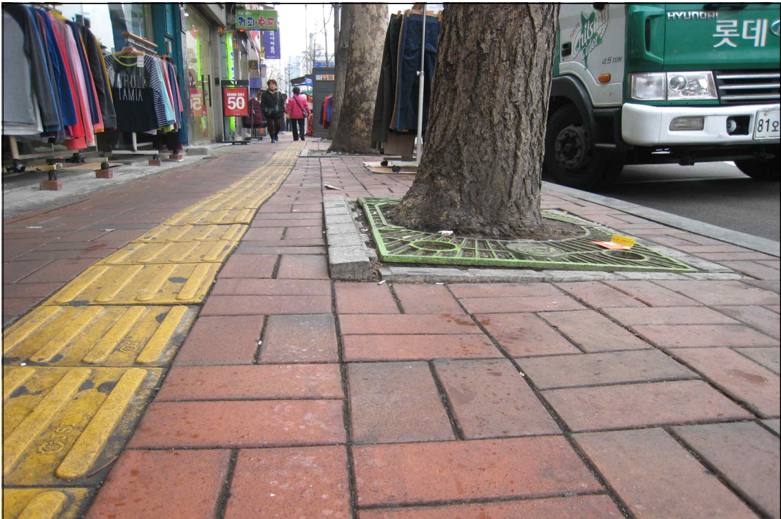
가로수 보호판 정비