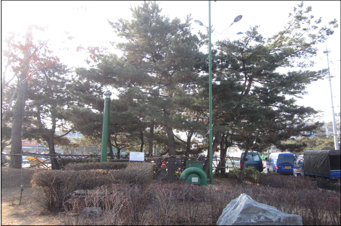
녹지대 수형조절 및 전지