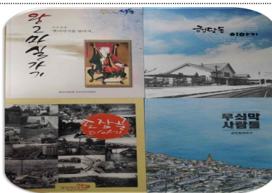
마을이야기 책자 발간