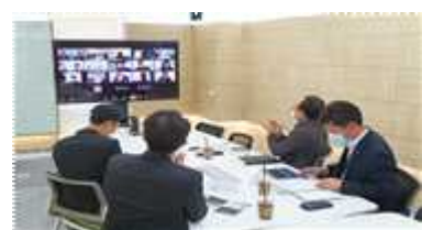
▲ 서울경제 활성화