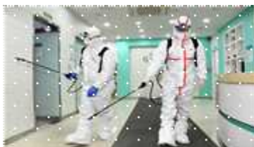
▲ 도시 브랜딩(안전도시 등)

❖ 서울의 우수한 방역정책과 경험을 앞세워 국제도시와 연대를 통해 '글로벌 표준도시 서울' 위상 확립