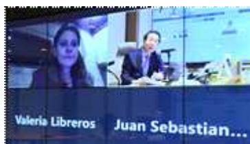
▲ 국제연대 강화