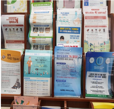
번2동 주민센터 비치

- 1차 제작·배포: 2020.03.05~03.06 (총 20,000부)