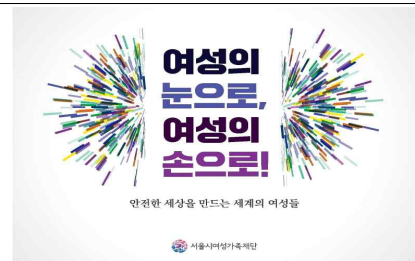
Photo Exhibition, "Building Safer Cities with women's view and women's power"