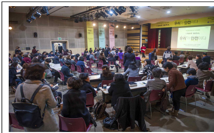
Discussion with citizens, policy makers and NGOs

지난 3월 8일 서울시여성가족재단에서는 세계여성의 날을 기념하여 토론회 ‘우리가 안전이다’를 개최함. 이번 토론회는 정책 전문가, 행정가 등의 이야기가 아닌 여성 안전을 위해 각자의 자리에서 고군분투하는 서울 시민들이 모여 여성 안전에 대한 이야기를 진행함. 토론회에서는 성폭력 피해자 권리 보호를 위해 법적 제도들이 제대로 작용하고 있는지 감시하는 단체 ‘첫 사람’ 회원, 가정 폭력 피해자들을 지원하는 지구대의 활동, 아동 학대 방지 및 피해 아동 지원 활동을 하는 굿네이버스 등의 활동을 공유하였으며, 공동체의 여성 안전을 위해 시민 각자가 네트워크가 되어 공동체 안전을 위해 노력해야 한다는 의견을 함께 함. 토론회에는 3.8일 당일 재단 대표이사로 임명된 K.H. Angela Kang이 함께 참여하여, 앞으로 여성 안전을 위한 재단의 노력 의지를 시민들과 함께 나눔