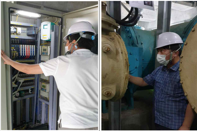
제어반 및 밸브점검 (길동배수지)