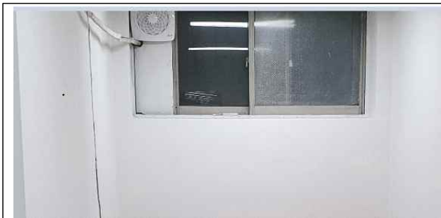
도색, 환기구 설치