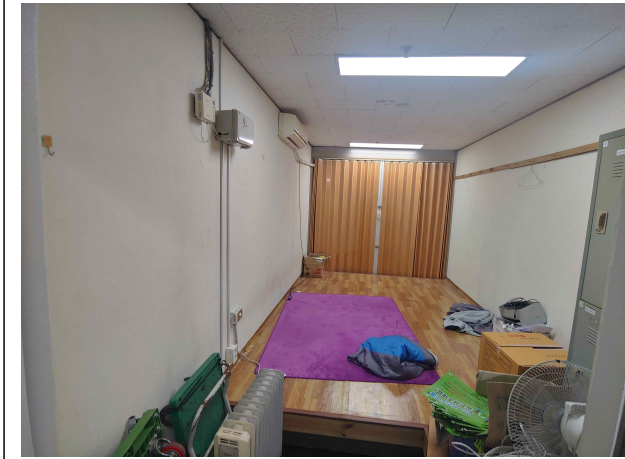
공무직 휴게실 정비 전