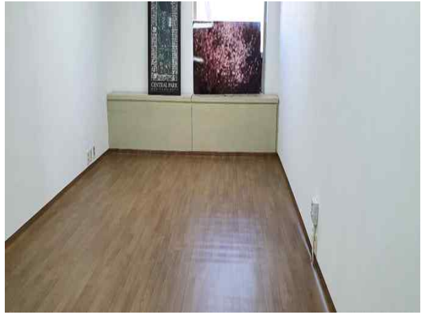
공공안전관 휴게실 정비 후