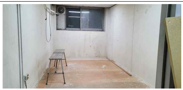
폐기물 처리 후