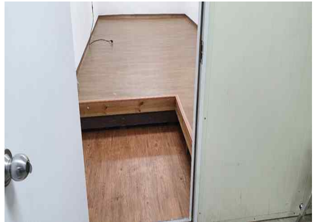
공무직 휴게실 정비 후