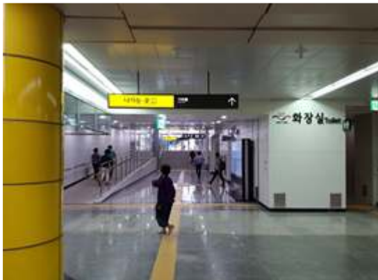
가락물 연결통로 전경