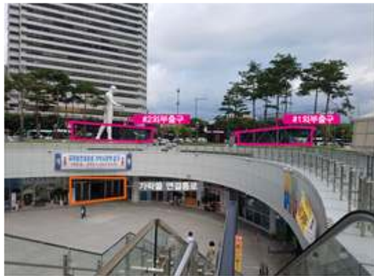
외부전경(기존 #1,2출구와 띈락물)