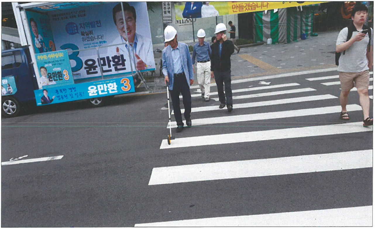
아스팔트포장도로 폭 확인