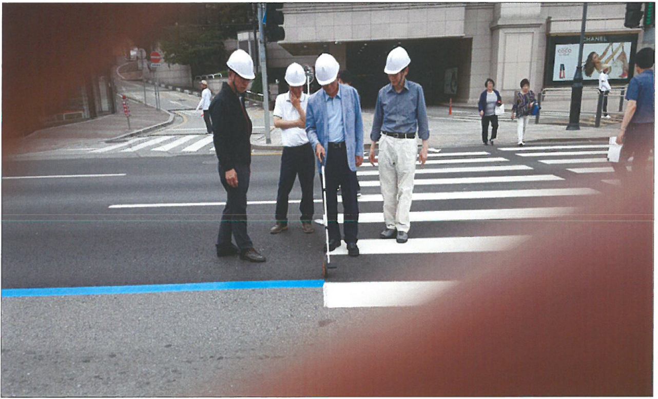
아스팔트포장도로 폭 확인