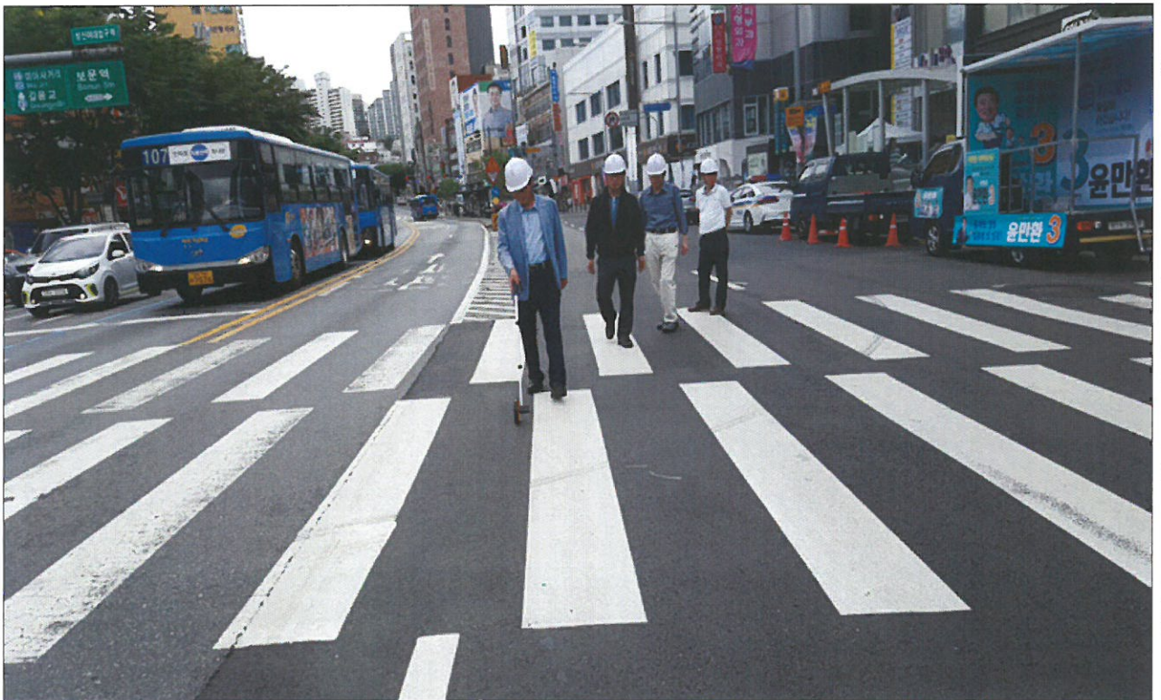
아스팔트포장도로 연장 확인