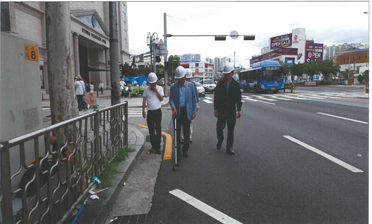
아스팔트포장도로 연장 확인