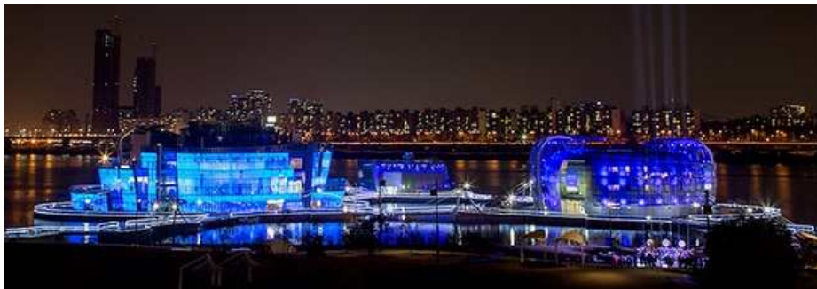
2014 세계당뇨병의날 푸른빛 점등식(한강 세빛섬)