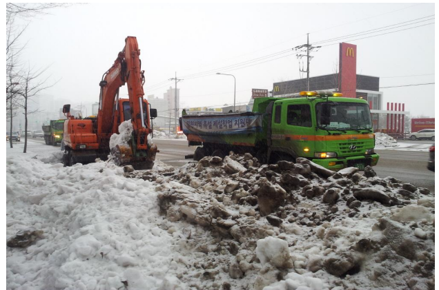
【속초지역 제설작업 현황】