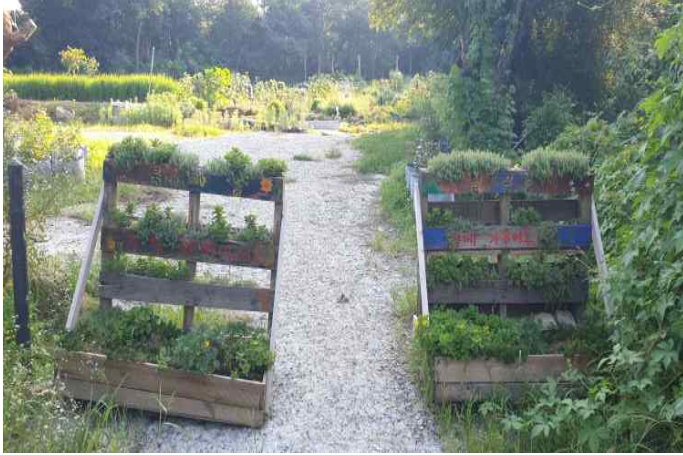
텃밭 입구 - 폐자재를 활용