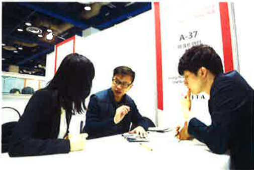
바이어 상담회장 내부 상담 모습