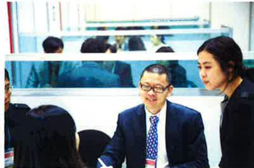
바이어 상담회장 내부 상담모습