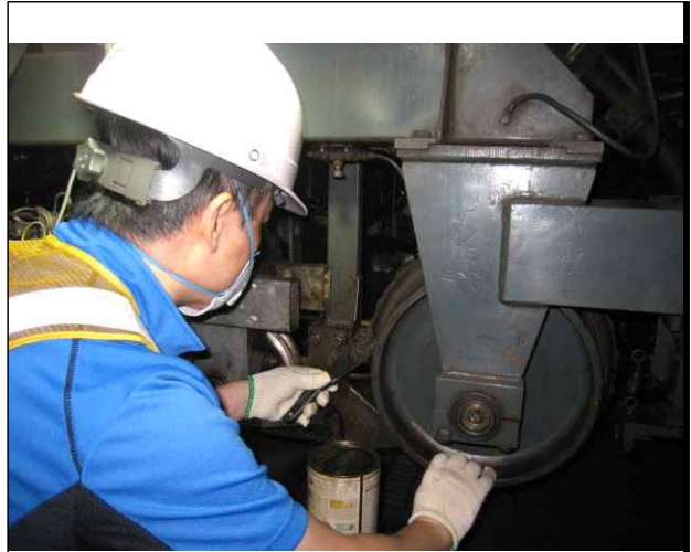
트로리 그리스 제거