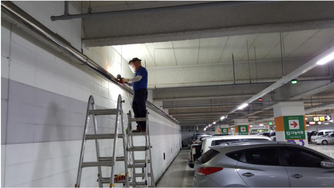
( 수평우수관 절단 _ STS 201 )