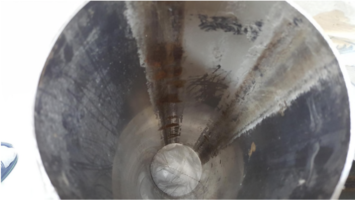
( 수평우수관(201) 내부 녹발생 )