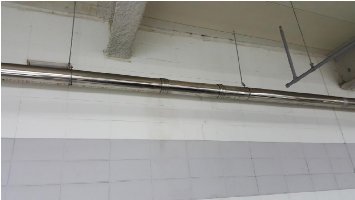
( 수평우수관 샘플 채취후 임시복구 )