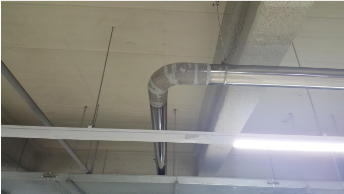
( 우수관 누수방지를 위한 임시밴딩 )