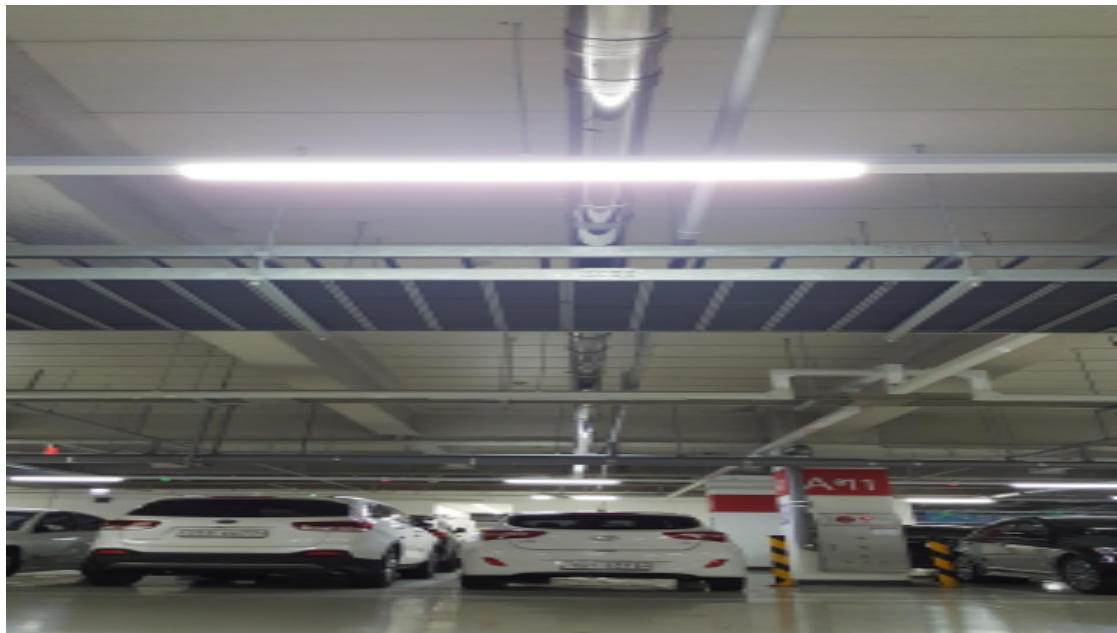
( 우수관 누수방지를 위한 임시밴딩 )