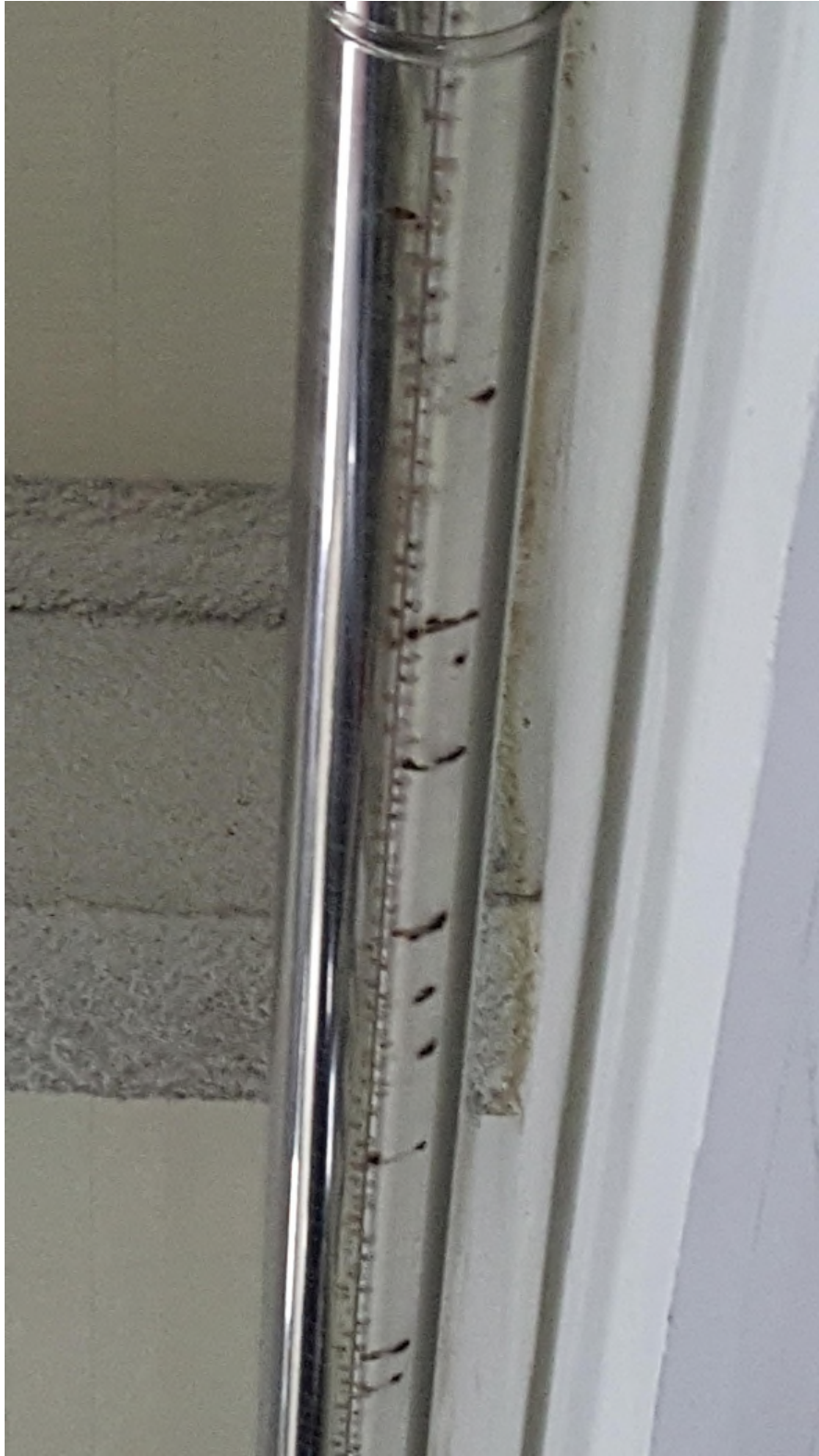
( 점부식이 발생한 가락물 수평우수관 )