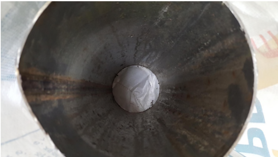
( 수직우수관(304) 내부 녹발생 )