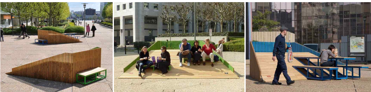
프랑스 파리 La Defense 광장