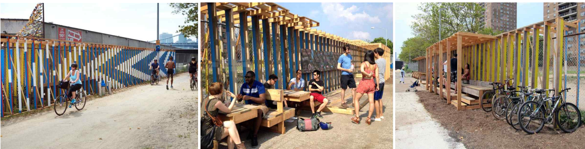
미국 맨해튼 부두42 팝업공원 내