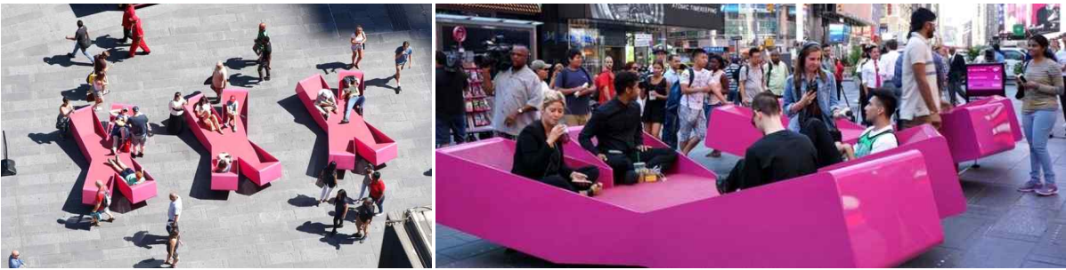
미국 뉴욕 타임스퀘어