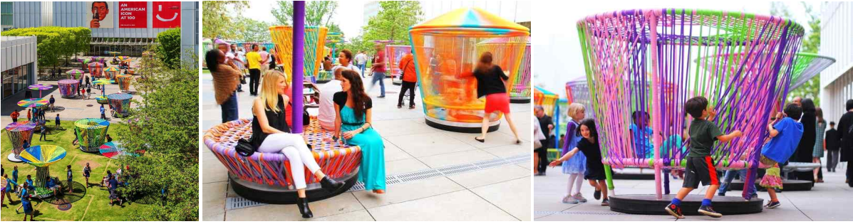
미국 애틀랜타 하이뮤지엄의 쉼터