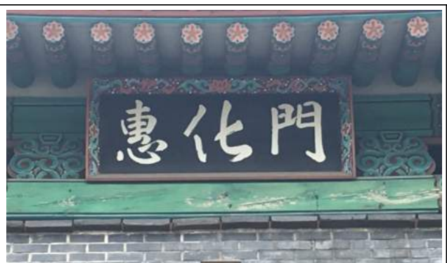
현재 혜화문 현판(1994년 작)