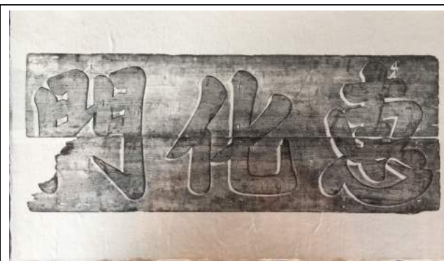
옛 혜화문 현판(1744년 작)