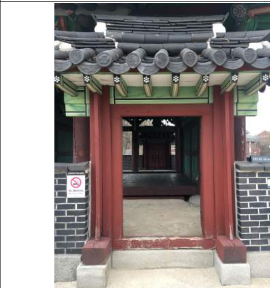
정면 우측 협문 보수 필요