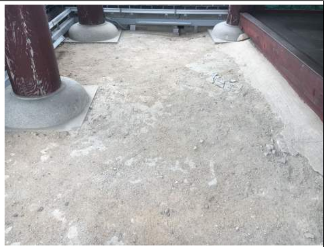
문루 바닥다짐 필요