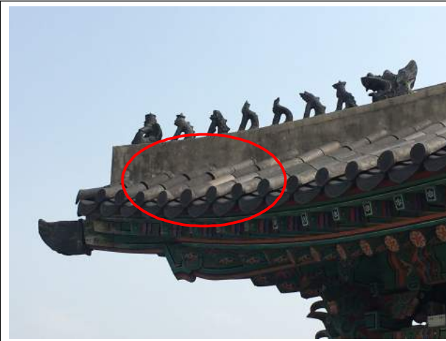
기와고르기 작업 필요