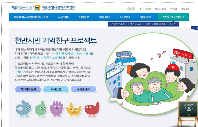
기억친구 프로젝트 소개