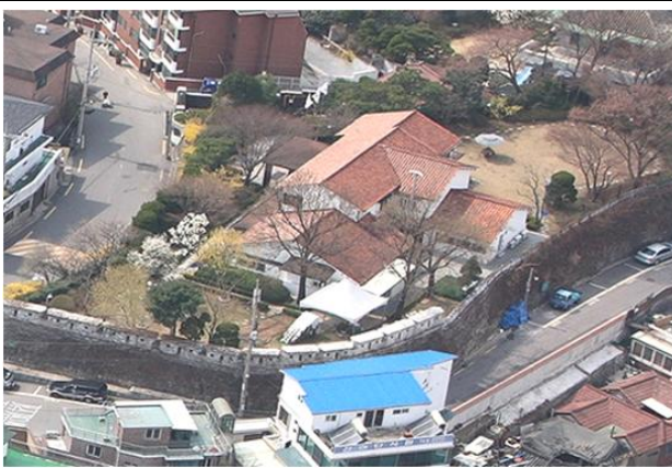
〈혜화동 옛 시장공관 전경〉