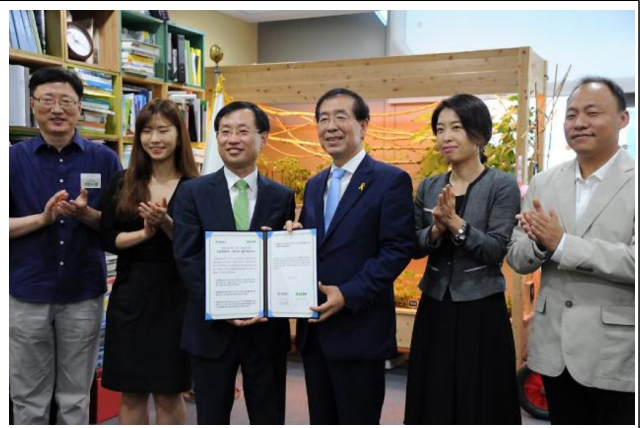
〈서울시-네이버 업무협약 체결, 7.18〉