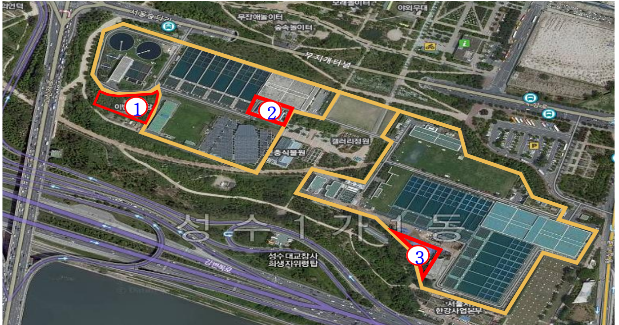
<대체부지 교환 : ①번의 서울숲 부지와 ②,③번 뚝도정수장부지 상호교환>