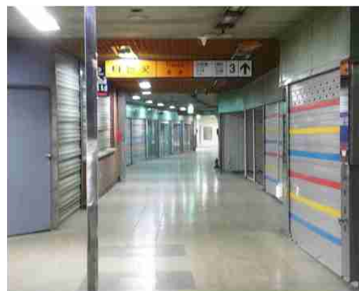
<지하 1층 현장사진>