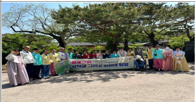
창덕궁 및 청와대 탐방