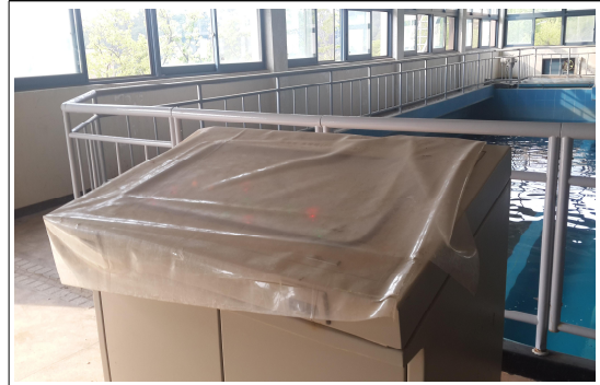
여과지 조작대 덮개 노후