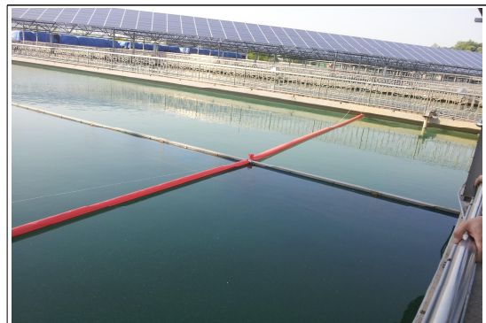
침전지 스킴유입 방지시설 설치(2)