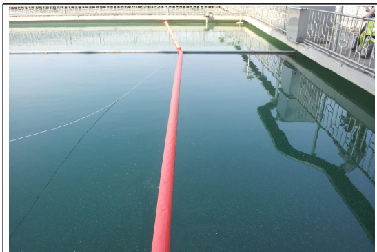
침전지 스킴유입 방지시설 설치(1)