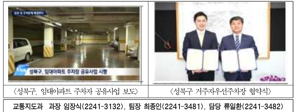
<성북구, 임대아파트 주차장 공유사업 보도>