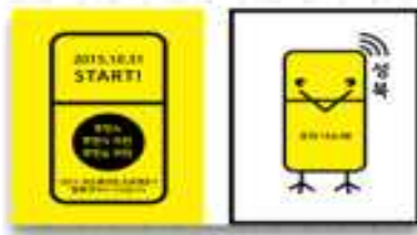
푸드쉐어링 홍보 포스터