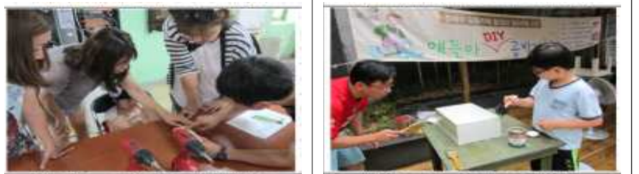
〈성북 동아 에코빌 아파트 공구사용수업〉