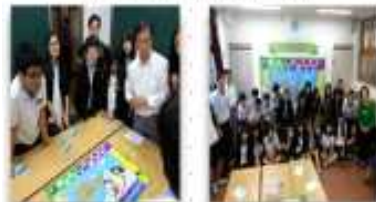
월곡중학교'우린 한 배를 탔어!' 수업 현장

사회적경제과 과장 박태일(2241-3142), 팀장 은현기(2241-3891), 담당 안연실(2241-3895)