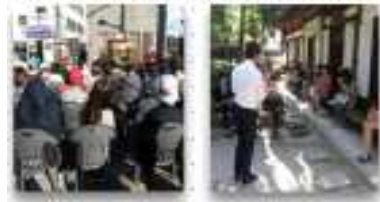
'방우산장과 성북동 문인들' 행사현장