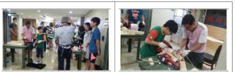
〈월곡 래미안 루나밸리 아파트 공방학교〉