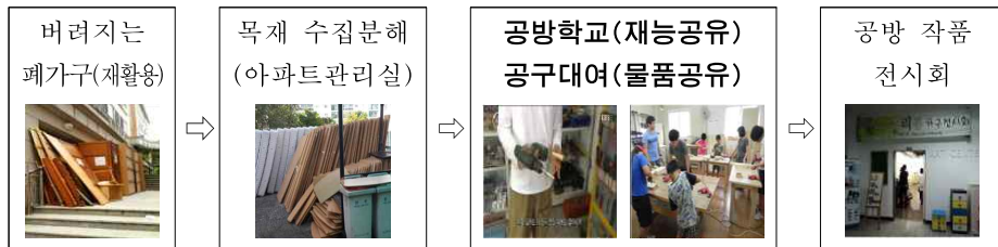
〈유휴공간을 활용한 DIY 공방 흐름도〉