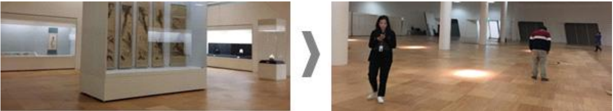
쇼케이스 구조물 철거