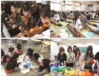
저소득층 예술영재 교육