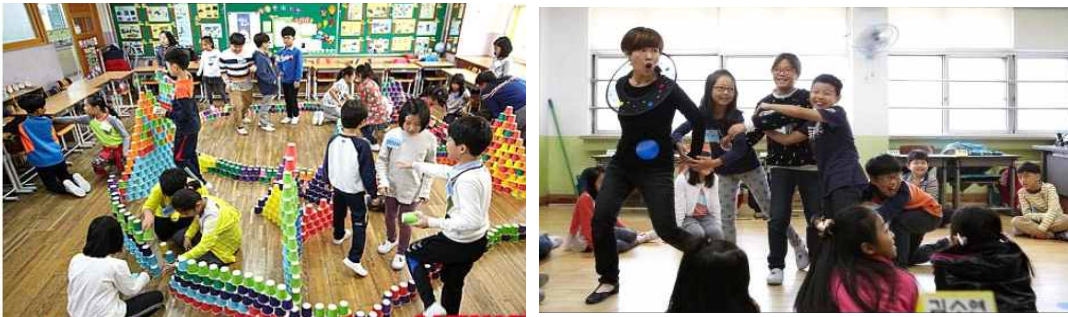
‘서울형 예술가교사’ 학교수업 현장