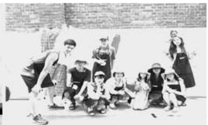
〈 삼성센터스 홍보대사 활동 〉