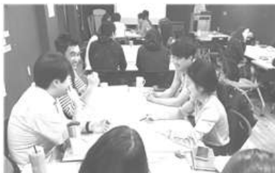
〈 내부 만족도 개선을 위한 토론 〉