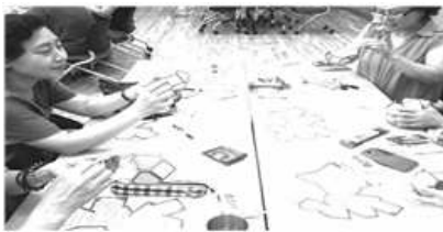
〈특화사업 지원, 양천구 전래놀이 봉사단〉