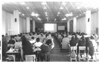
〈몽골현지 사회복지공무원 자원봉사 교육〉