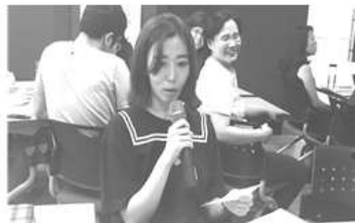
〈 갈등관리 조정사례에 대한 교육 〉