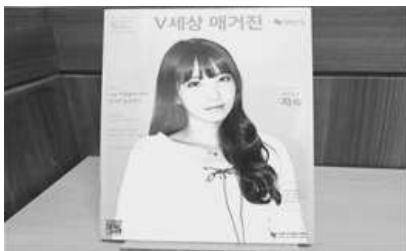
〈 자원봉사 매거진 발간 〉