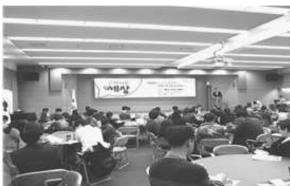
〈온라인 플랫폼 런칭 기념 포럼〉