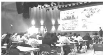
〈 공공기관 자원봉사관리자 교육 〉