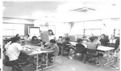
〈 청소년 시민 아카데미 〉