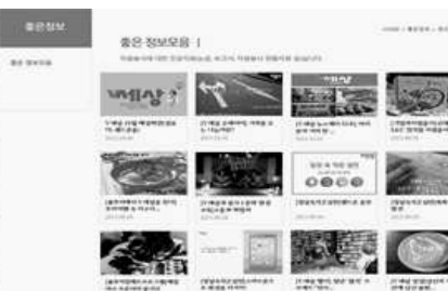
〈온라인 아카이브 '좋은정보모음'〉