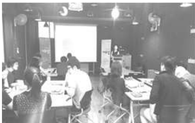
〈 CS경영의 이해를 위한 교육 〉