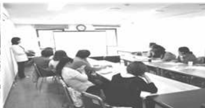
〈자치구센터 순회방문 간담회, 서초구〉