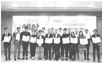
< 런칭 설명회 >