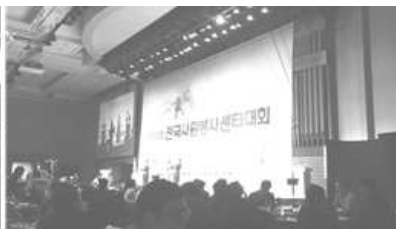
〈 전국자원봉사센터 대회 참가 〉