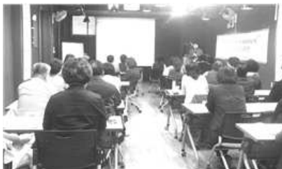
〈 공모사업 선정단체 오리엔테이션 〉