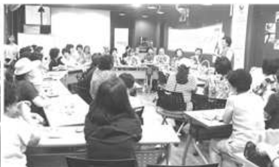
〈 임팩트프로그램 선정단체 오리엔테이션 〉