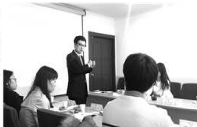
〈시·구센터 기업관리자 네트워크〉