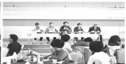
〈자원봉사 캠프 리더 워크숍〉