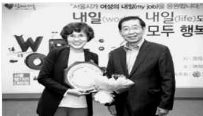
〈서울시 가족친화경영 시장표창〉