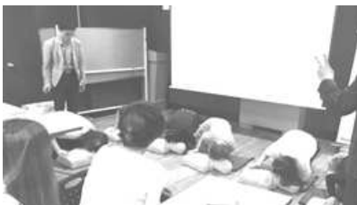
〈 지식나눔워크숍 실시-심폐소생술 〉