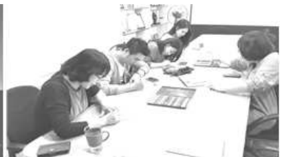
〈 공동체 역량개발 동아리 활동 〉