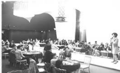
〈 시민 아카데미 〉