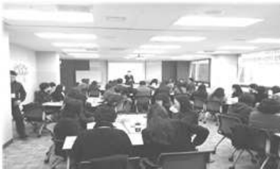
〈 신입관리자 교육 〉