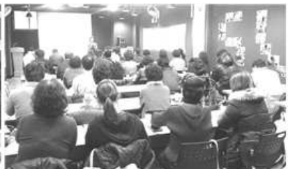
〈 풀뿌리 성장학교 〉