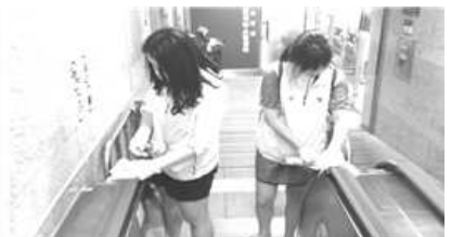
〈 메르스관련 다중이용시설 소독 〉