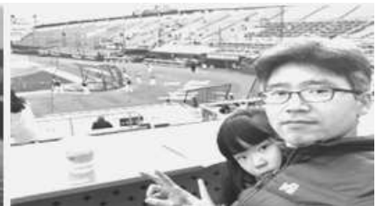
〈유연근무를 통한 일가정양립 문화 조성〉