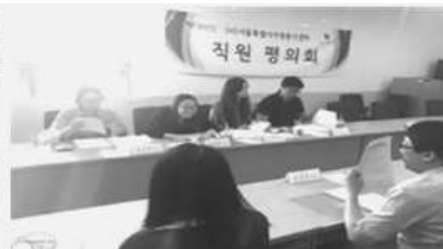
〈직원 평의회 개최〉