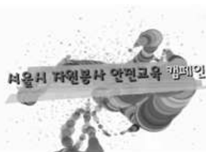
〈 자원봉사활동 안전영상 제작 〉