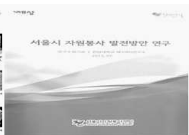
〈서울시 자원봉사 발전방안 연구〉