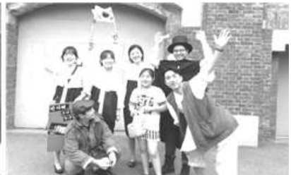
< 독립투사, 시민과 함께하다 실천활동 >