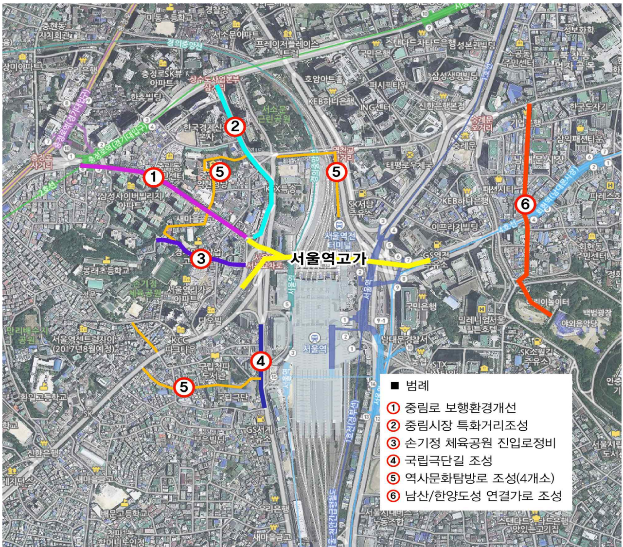
〈서울역 일대 활성화지역 보행 문화거리 위치도〉