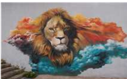
동물사 벽화작업후 모습

○ '16. 7월 ~ : 기업의 사회공헌을 연계한 시민·기업 후원그룹 확대 (봉사활동 → 대공원 이미지 향상 → 바이럴 마케팅화)