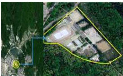
위치도 및 현황사진