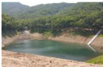
취수시설(사통) 신설 완료