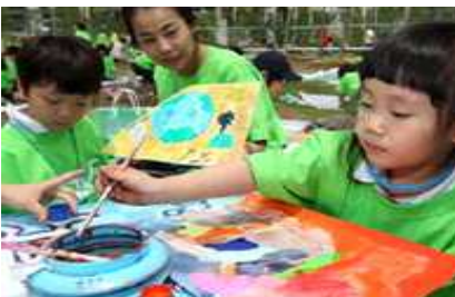
어린이 그림대회 진행모습