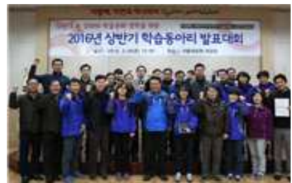
상반기 학습동아리 발표대회