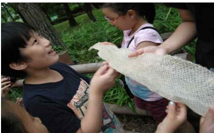
한여름밤 동물원 대탐험