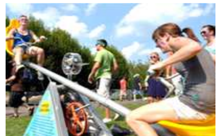
친환경 행사 진행 모습