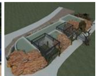
야행관 리모델링 공사후