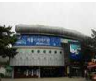
해양관 리모델링 공사전