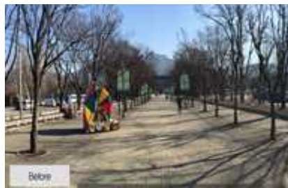
주 진입로 현황(전)