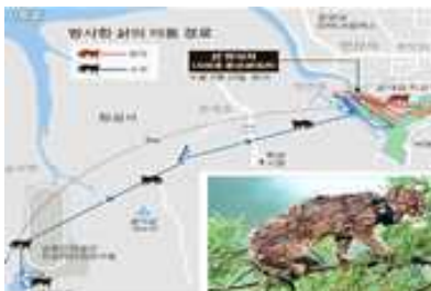
2014.6.30. 주요일간지 보도