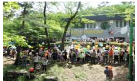
어린이날 기념 나비날리기