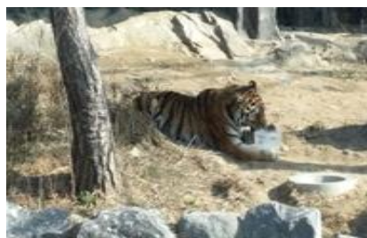
호랑이 얼음 넣어주기