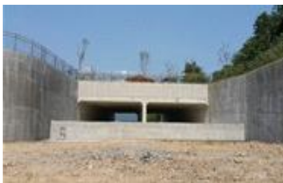
여수로 확장 설치 완료