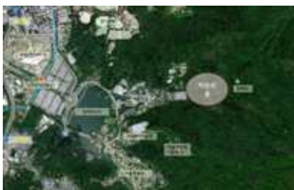
치유의 숲 위치도