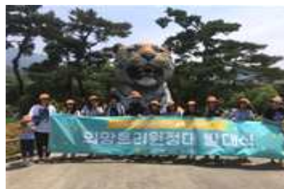
희망트리 원정대 발대식 모습