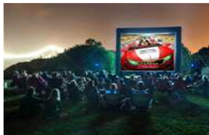
영화상영회 진행 모습