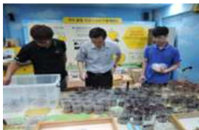
밀반입 곤충류(전갈, 지네등)