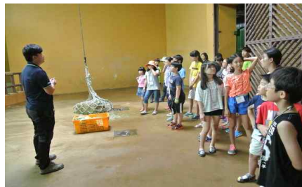
서울동물원 Job Star!