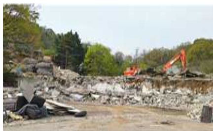
기존 건축물 철거