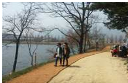
호수주변 매트 설치