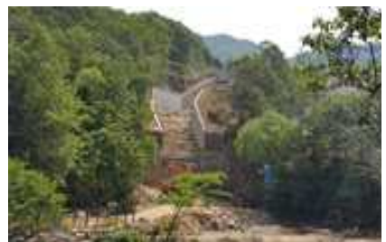
관람시설(폭포) 설치 중