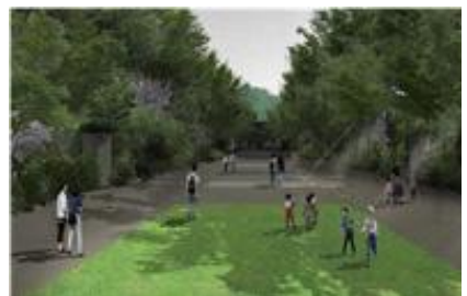
주 진입로 조성(후)