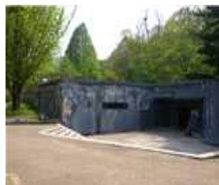
야행관 리모델링 공사전