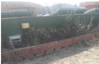
원숭이사 강제배기 방식