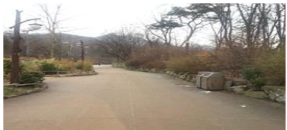
유인원관 앞 관람로