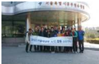
공무직 노사 합동 공동연수