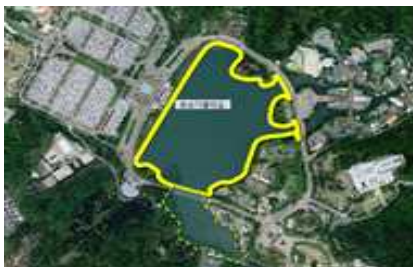
호숫가둘레길 연결 코스