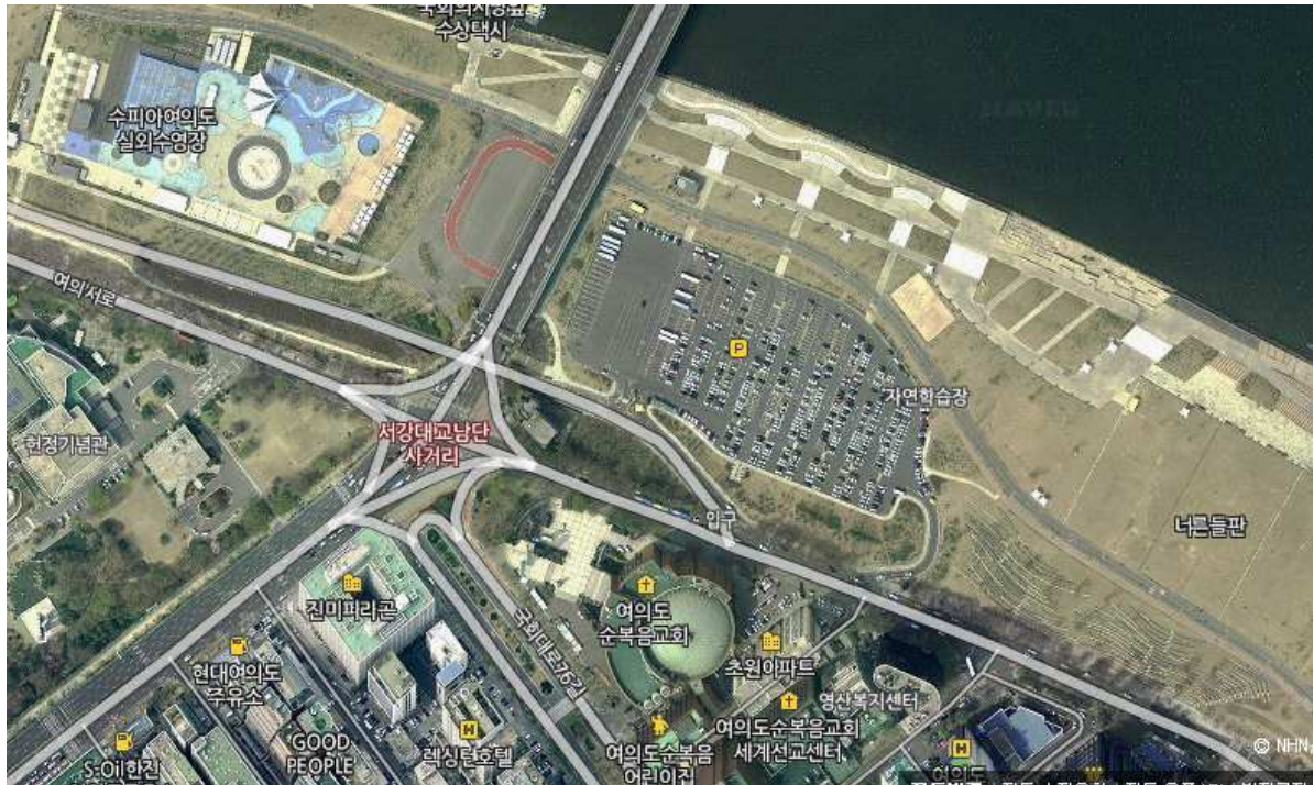
〈그림 1〉 여의도순복음 교회 및 서강대교 남단 한강공원 주차장