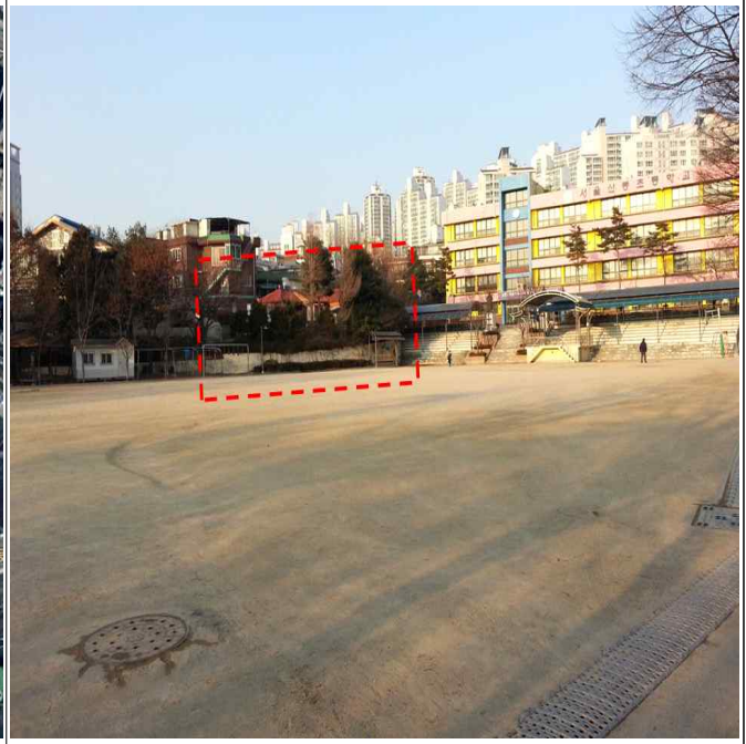
체육관 및 급식시설 증축 위치