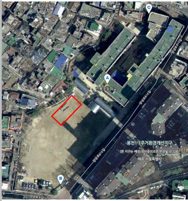
체육관 및 급식시설 증축 위치