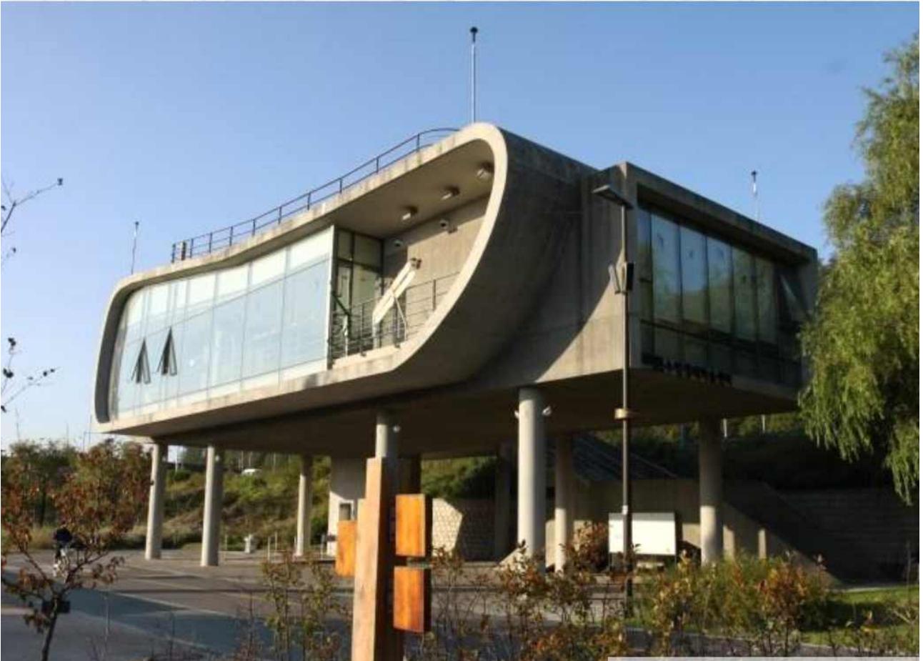
<그림 1> 난지생태습지원 및 수변생태학습센터 조성 현황