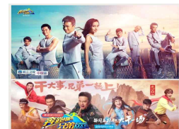
〈중국판 런닝맨 PPL〉