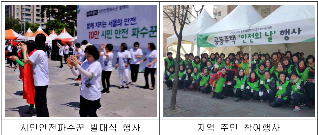
[그림] 시민안전파꾼 활동 내역