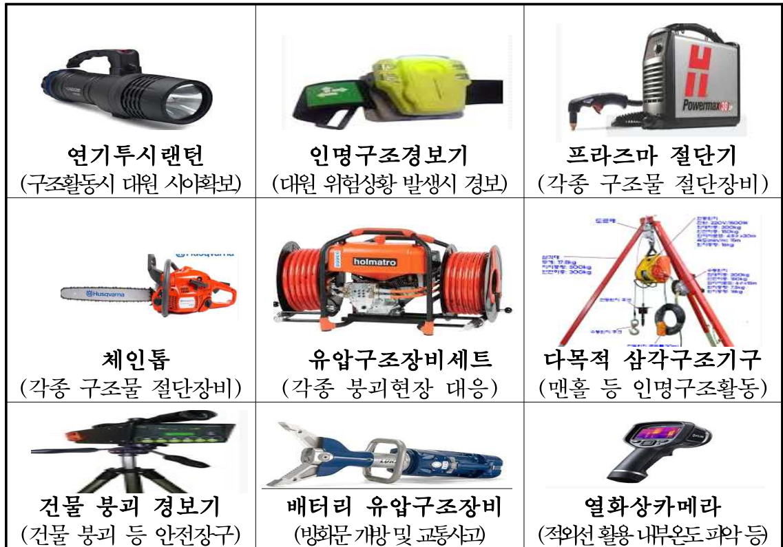
[표] 주요 구조장비 소개

위해 사고 유형별 장비 보강 및 노후장비 교체와 첨단장비 확보로 초동대응체계를 확립하고자 하는 사업으로, 전년대비 31% 감액된 38억 66백만 원을 편성하였음.