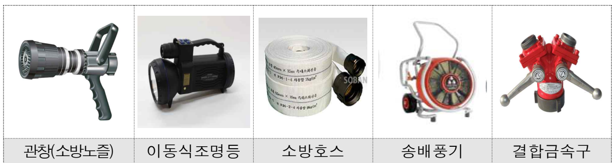
[그림] 각종 화재진압장비 예시