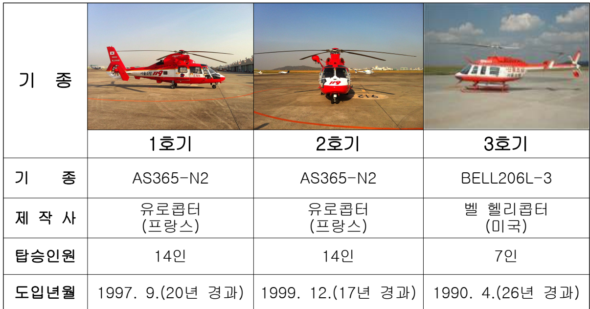
[표] 소방헬기 현황 : 3대 (AS365N2 프랑스산 2대, BELL206L-3 미국산 1대)