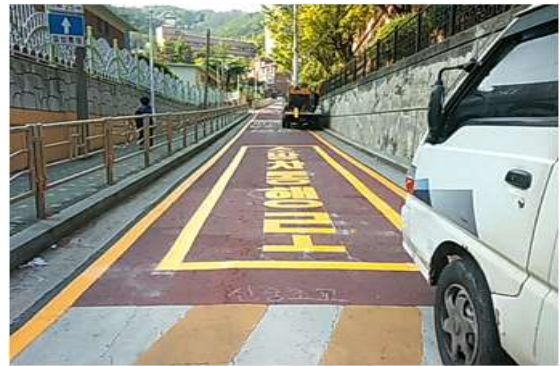
「소방차통행로 노면표시」 설치 전·후