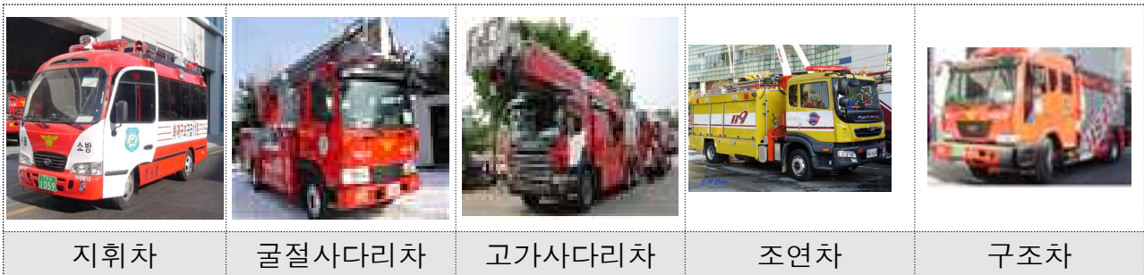
[그림] 각종 소방차량