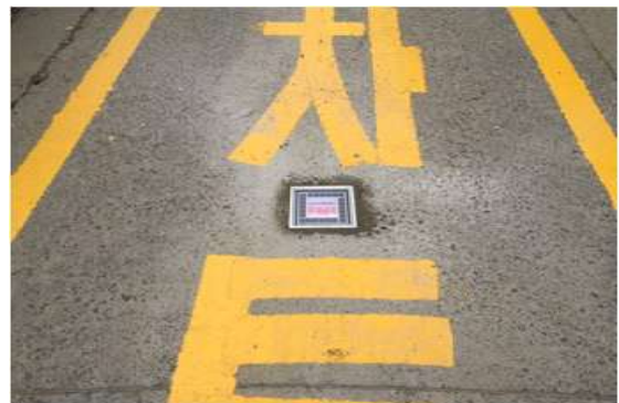
「태양광조명블럭」 설치 전·후