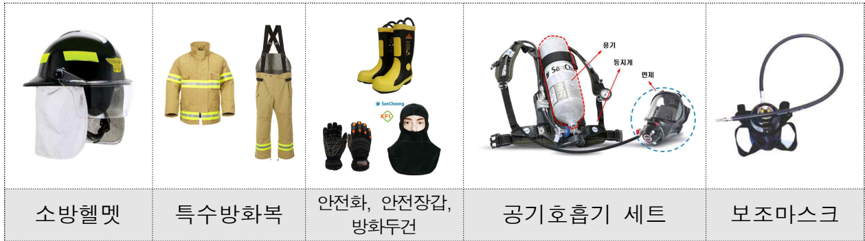
[그림] 각종 개인보호장비 예시