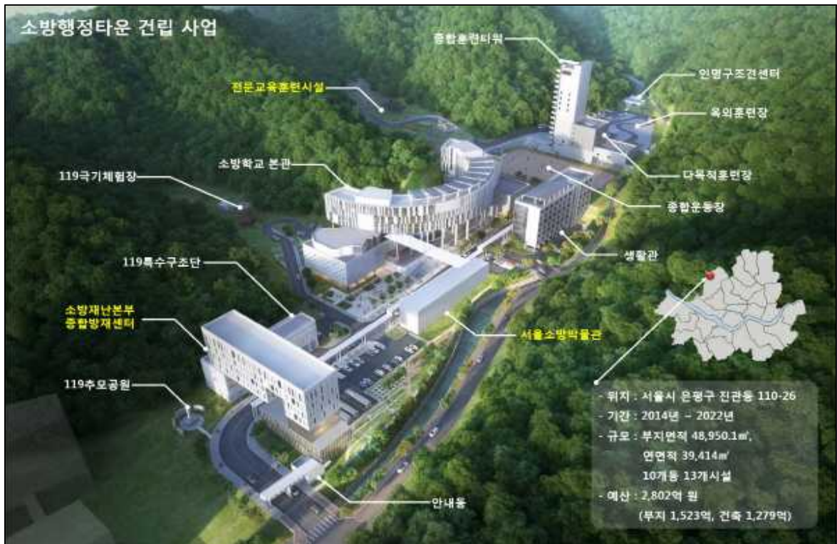
[그림] 소방행정타운 건립 조감도