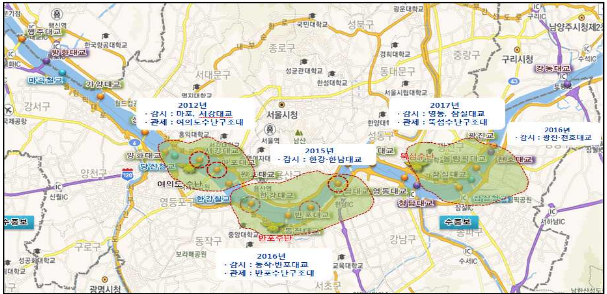
[그림] 한강교량 CCTV영상감시 출동시스템 구축 현황 및 계획