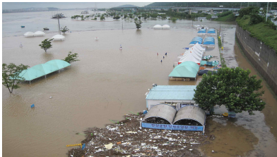
망원(7.28, 팔당댐 15,056톤/초 방류)