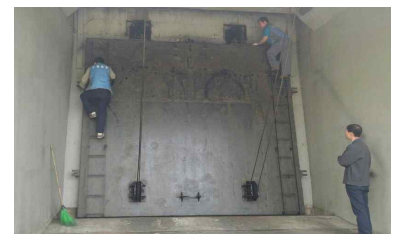
〈육갑문 안전 점검〉