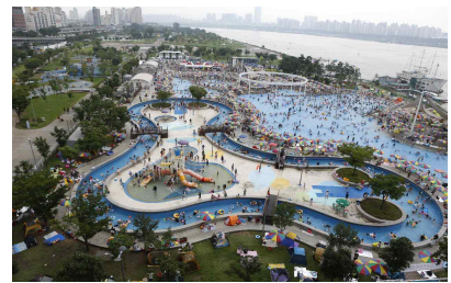
< 뚝섬 수영장 >