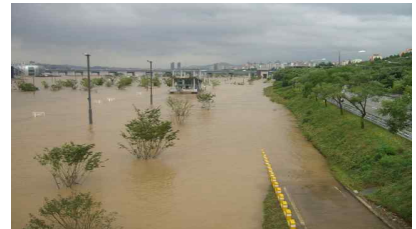
반포(7.16 팔당댐 15,056톤/초 방류)