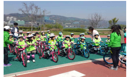
〈어린이 자전거 안전교육〉