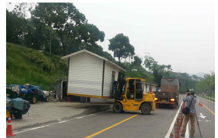
〈반포 녹지창고 대피 (모의훈련)〉