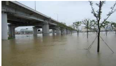
반포(8.21 팔당댐 7,837톤/초 방류)