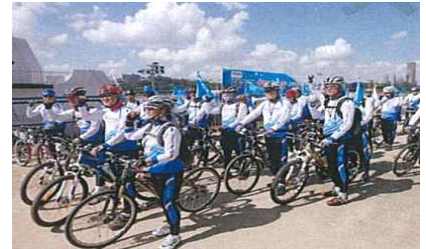
〈자전거 안전 캠페인〉