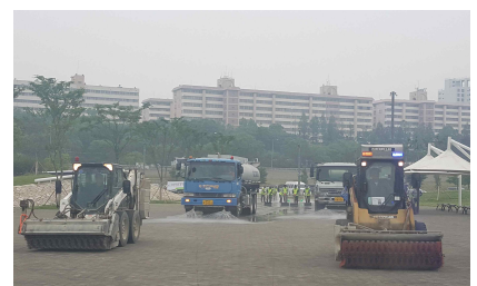
〈반포 달빛광장 뺄 제거 (모의훈련)〉