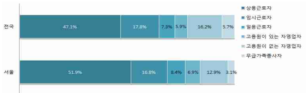
〈그림 2〉 2012년 서울지역 노동인구 종사자 지위 비중