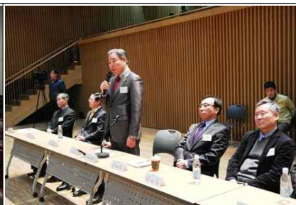
통합방위회의 의견 발표