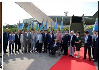
여의도공원 C-47 전시