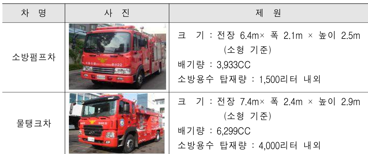
[표] 소방펌프차 및 물탱크차 제원