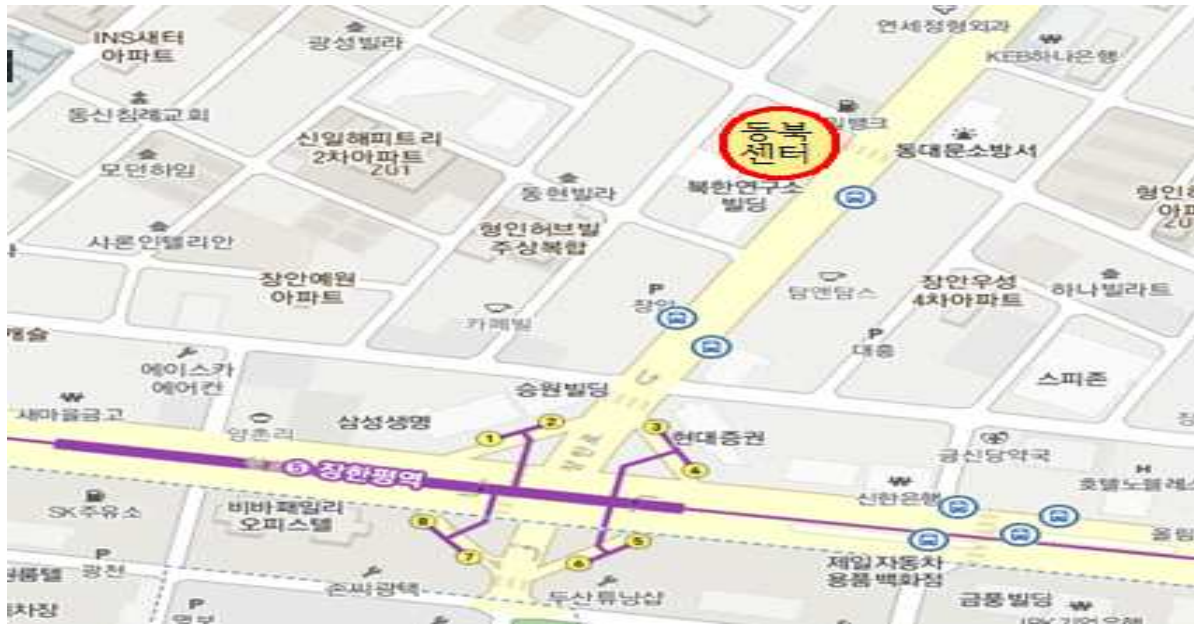
위 치 도