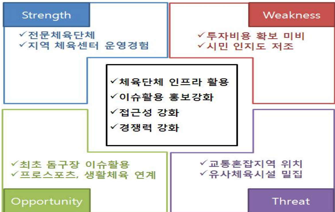
〈표9 서남권 돔구장 수영장 및 체력단련장 운영 시 SWOT분석〉

현 시대에 맞는 마케팅적 관점에서 유소년과 청소년, 어르신 등 생애주기별 체육프로그램 보급 확대와 생활체육 참여여건 조성, 엘리트 체육의 근간인 학교스포츠클럽의 활성화를 통한 스포츠경쟁력 강화, 스포츠 네트워크 강화 및 조직기반 조성 등과 함께 서울 체육회 선진화를 지향할 수 있도록 시스템과 제도를 구축해야 할 필요성이 있는 것으로 사료됨.