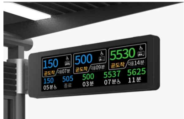
버스정보안내단말기 혼잡도 정보