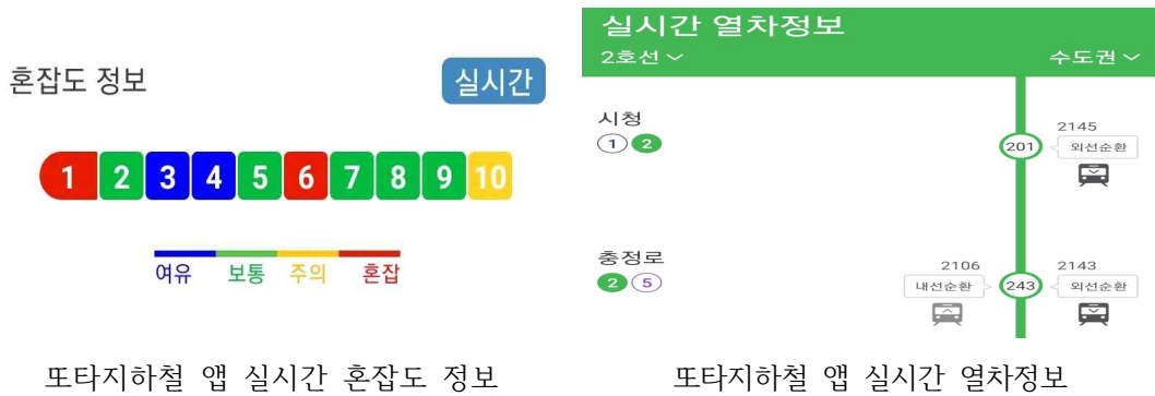
또타지하철 앱 실시간 혼잡도 정보