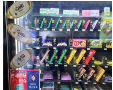
자판기 내 마스크 판매 (지하철)