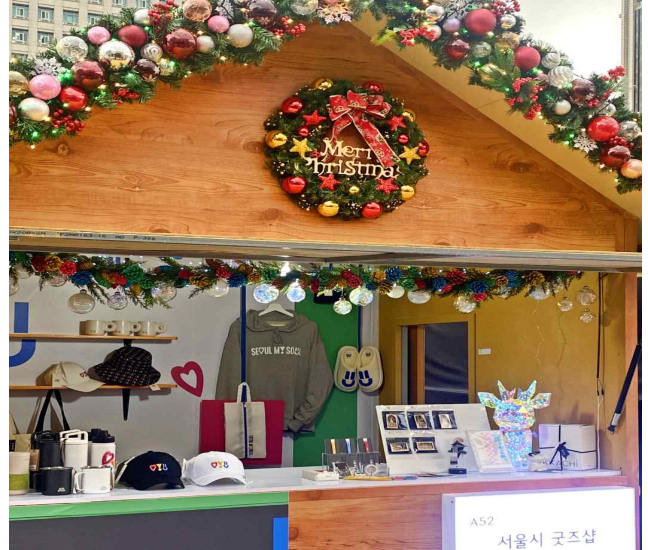
서울 굿즈 샵