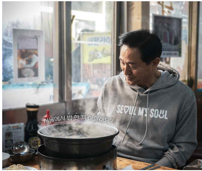
서울, 마이 소울 후드티