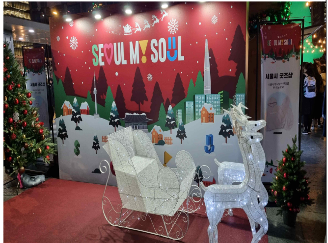
크리스마스 체험 포토 존