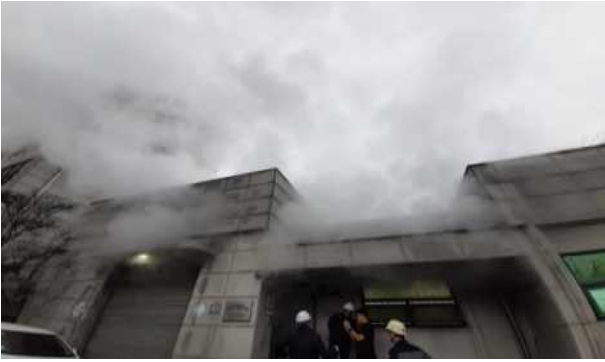
신정가압장 외부 증기 누출