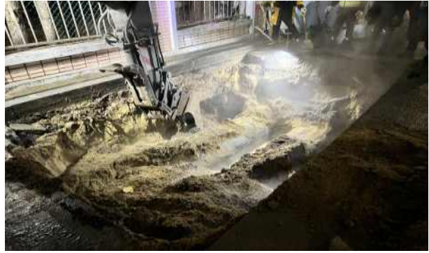
부단수 장비 설치