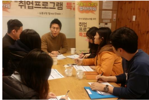
2. 소그룹 순환 멘토링