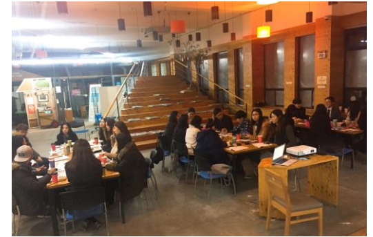
3. 소그룹 순환 멘토링