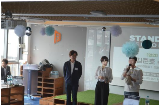
1. 멘토 소개