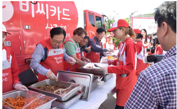
중식배식(내빈 자원봉사 시연)