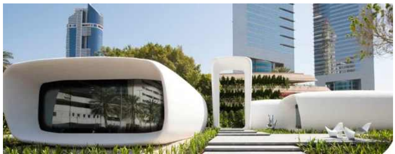
미래의 사무실(Office of the Future, 3D 프린팅 건축물)