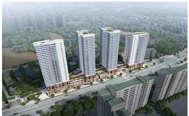
조 감 도