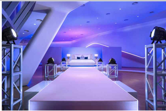
DDP 숙박공간 내 침실