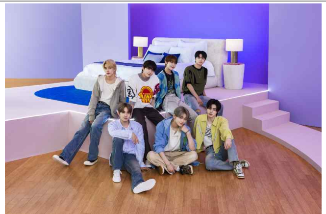
DDP 숙박공간에서 '엔하이픈'