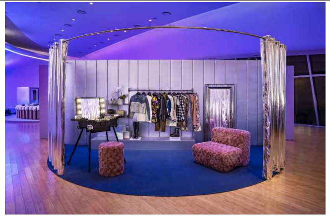
DDP 숙박공간 내 드레스룸