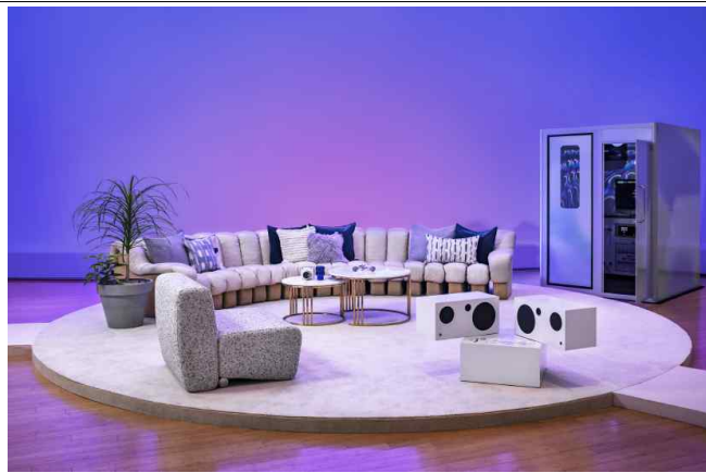
DDP 숙박공간 내 거실