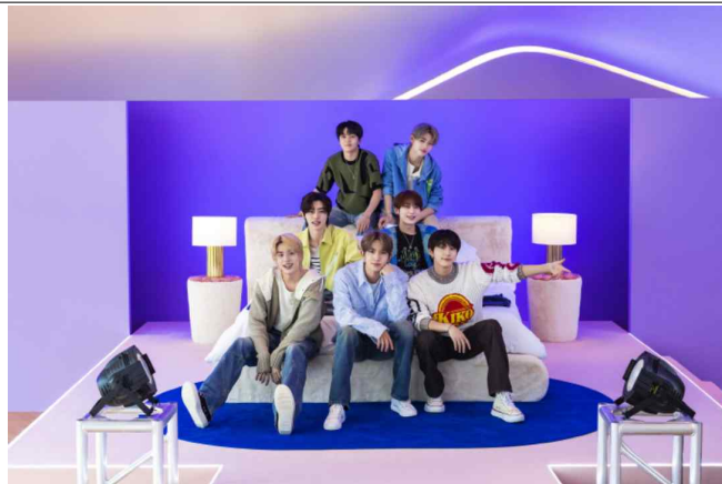
DDP 숙박공간에서 '엔하이픈'